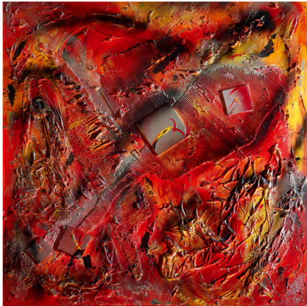
Icarus in the Fire of Freedom, mixed media, 120 x 120 cm, 2012

麗莎自己從未踏足這東的土地，她說，「最多，我只在腦海裡、夢境中和我的想像裡去過。但或許那就是在我眼中吧。據我所知，我沒有亞洲的親戚或祖先，但自幼年起，我就一直反復說到它。儘管我金髮碧眼，我有暗金色的頭髮，但我的眼睛是杏仁狀的，明顯帶著這東人種的特徵。所以，這應該與某些血緣有一定關係。」