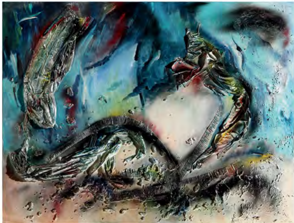
Rivalry of sea serpents, mixed media, 120 x 160 cm, 2013

麗莎·艾特利奇顯然掩蓋了遠東的自我。她繪一幅《旭日下的大地》；她以自己的抽象方式創造一幅《中國之舞》，一幅《中國人》或《亞洲之弓》；她把《舞動的鬍子》表現地鮮紅而愉悅；她用一條「火龍」去象徵《三位使節的力量》——說的是布萊希特那出題為《四川好人》的戲劇中的故事。她以自己那幾乎並不互相機動和彼此豐富的世界大同主義作品，將西方世界與東方的虔誠和智慧結合起來，並且最好地搭建起了不同文化之間的橋樑。