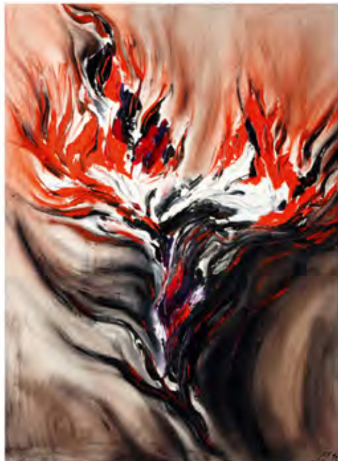
Animalistic Rage, Oil on canvas, 60 x 80 cm, 1994