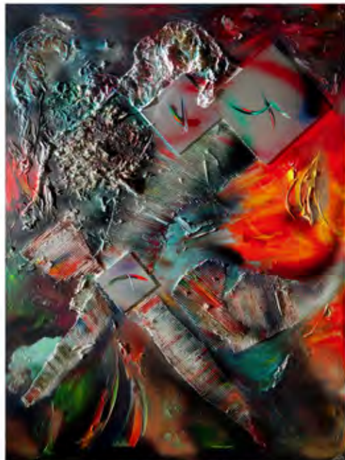
Cerberus Hellhound, mixed media, 120 x 160 cm, 2012